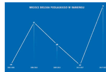
Wykres przedstawiający miejsca rankingowe Bielska Podlaskiego na przestrzeni lat. Grafika Mirosław Karolczak