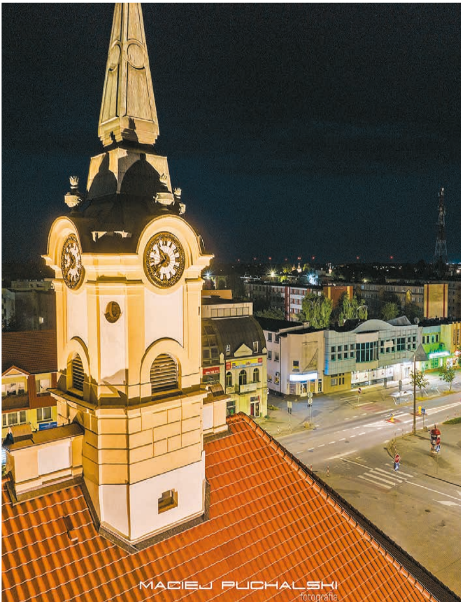
Centrum Bielska Podlaskiego nocą.