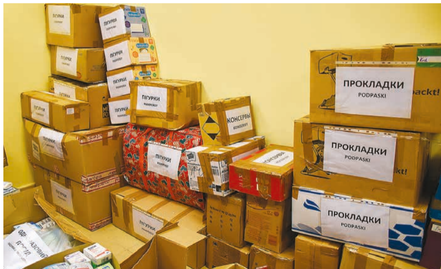
Dary zebrane w urzędzie miasta do transportu do miasta partnerskiego – Rachowa na Ukrainie.