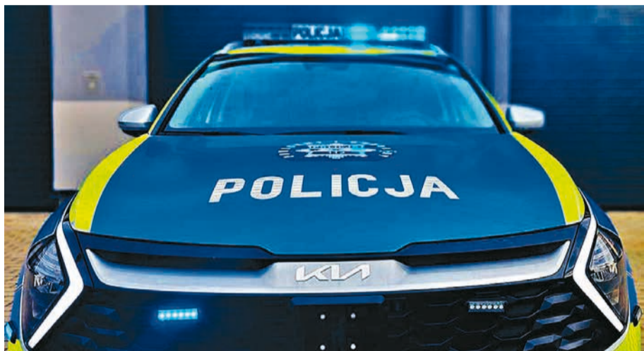
Jeden z policyjnych radiowozów, którego zakup dofinansowany został przez Miasto Bielsk Podlaski.

We współpracy z Komendą Powiatową Państwowej Straży Pożarnej w Bielsku Podlaskim podejmowano działania minimalizujące rozprzestrzenianie się zanieczyszczeń. Zakup materiałów do odczyszczania wody kosztował 5 000 złotych, zaś koszt utylizacji zebranej substancji ropopochodnej i zużytych materiałów to 13 707,36 złotych. (Zk)