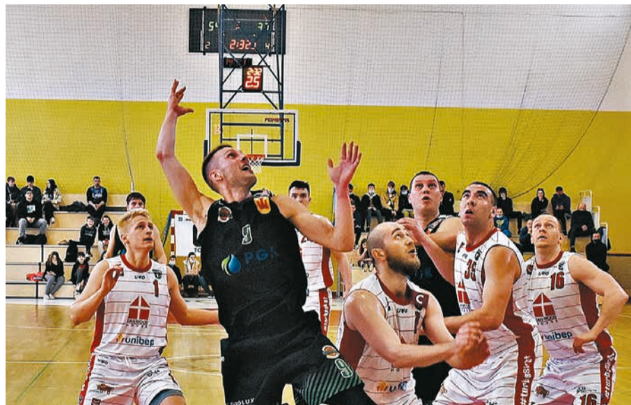
Sala sportowa Szkoły Podstawowej nr 3 została wyremontowana i doposażona m.in. w rozkładane trybuny dla kibiców.

W marcu 2022 roku oddano do użytkowania wybudowany przy Szkole Podstawowej nr 5 im. Szarych Szeregów plac zabaw dla dzieci. Koszt budowy przyszkolnego placu zabaw wyniósł 77 867,04 złotych.