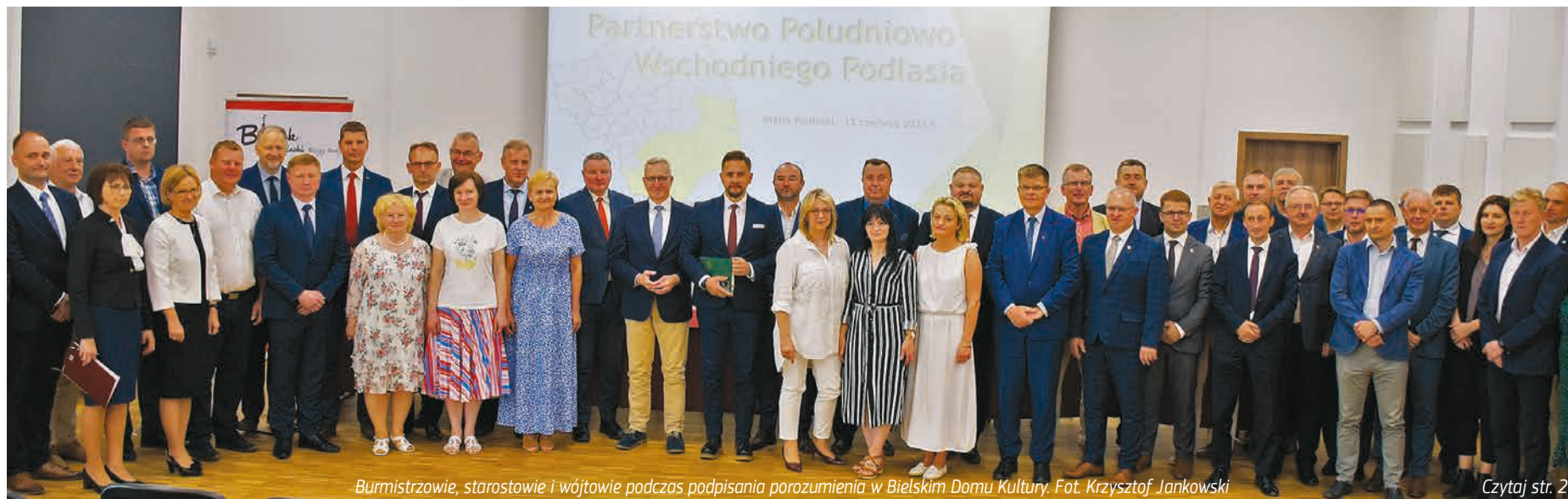
Burmistrzowie, starostowie i wójtowie podczas podpisywania porozumienia w Bielskim Domu Kultury.