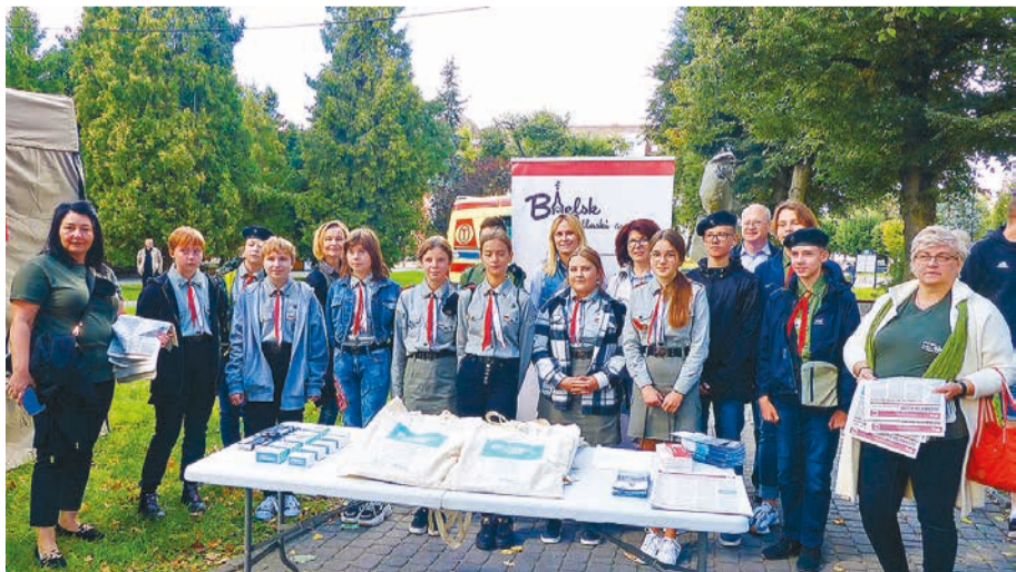
Akcja „Rosnąca Odporność” w plenerowym punkcie szczepień.