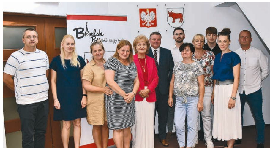
Aktualny skład Bielskiej Rady Działalności Pożytku Publicznego.

uchwał i aktów prawa miejscowego, dotyczących sfery pożytku publicznego. (Ok)