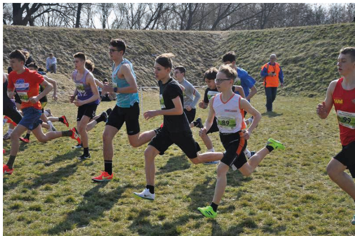
28 marca 2026r w sobotę na terenie Parku Radziwiłłów w Białej

Podlaskiej, przy pięknej słonecznej pogodzie, rozegrane zostały Między-