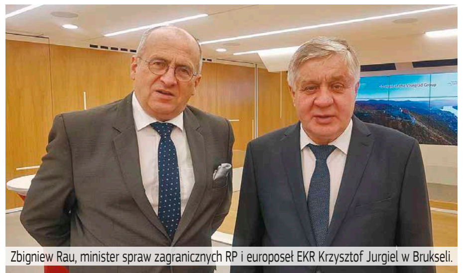
Zbigniew Rau, minister spraw zagranicznych RP i europoseł EKR Krzysztof Jurgiel w Brukseli.

szością kwalifikowaną w takich dziedzinach jak: sankcje i sytuacje nadzwyczajne. Konieczne jest dostosowanie uprawnień UE, zwłaszcza w dziedzinie zdrowia, transgranicznych zagrożeń dla zdrowia, osiągnięcia unii energetycznej