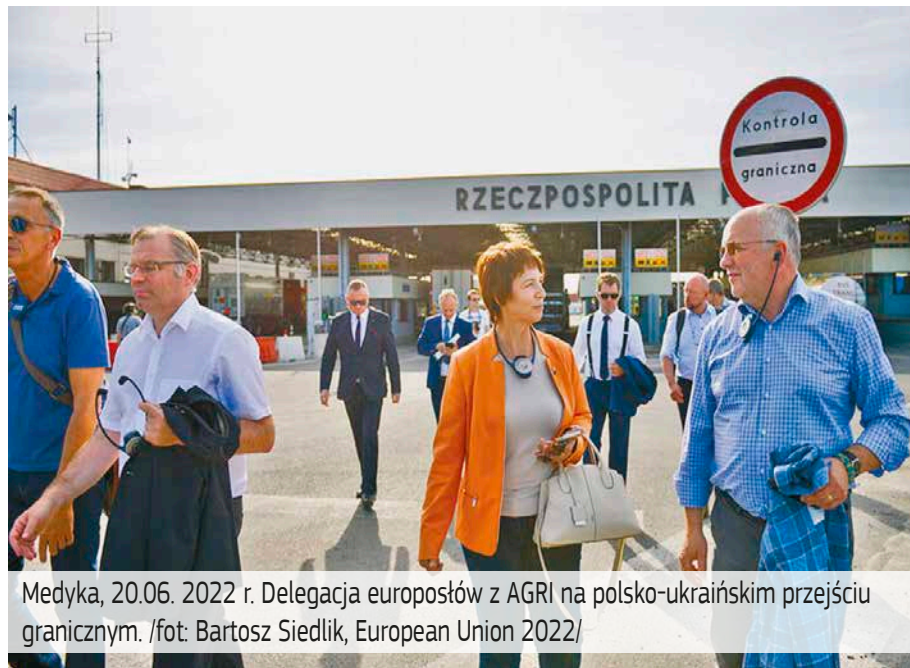
Medyka, 20.06. 2022 r. Delegacja europośców z AGRI na polsko-ukraińskim przejściu granicznym.

Jednocześnie zwrócił się do europościa, by ten na w/w posiedzeniu Komisji Rolnictwa PE poruszył sprawy wdrożenia w życie zapowiedzi Komisji Europejskiej „wyrażonych w Komunikacie nt. Korytarzy solidarnościowych (zwłaszcza dot. wsparcia infrastrukturalnego na granicy)”, które, zdaniem resortu, o tej pory pozostały w dużej mierze w sferze deklaracji.