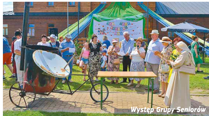
Występ Grupy Seniorów

Parafialne pikniki, festyny w Bielsku Podlaskim i okolicy rozpoczynają się mszą św., homilią nawiązującą do rodziny, jako największego skarbu. Dodatkowym akcentem ze względu na funkcjonujące przedszkola przy parafii Matki Bożej z Góry Karmel i parafii Najświętszej Opatrzności Bożej są występy, prezentacje najmłodszych parafian. W bielskim „Karmelu” obchodzono jubileusz 10-lecia przedszkola „Karmelki”, a w „Opatrzności” na Hołowiesku, jubileusz 5-cio lecia istnienia przedszkola działającego przy parafii.