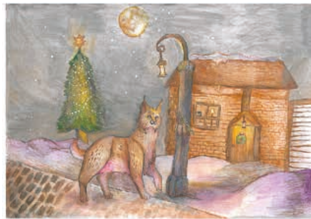
Pola Potoczniak, 11 lat, Zespół Szkół nr 2 im. Prymasa Tysiąclecia Szkoła Podstawowa nr 5 w Markach (III miejsce, I kategoria wiekowa)