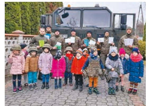
Przedszkole nr 2

mali patrioci mieli możliwość obejrzenia ciężkiego samochodu wojskowego.