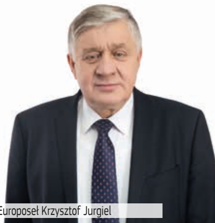
Europeusek Krzysztof Jurgiel

Obszary wiejskie mogą lepiej prosperować, jeśli wprowadzą dywersyfikację działalności gospodarczej w nowych sektorach, co będzie miało wpływ na zatrudnienie i zwiększy wartość