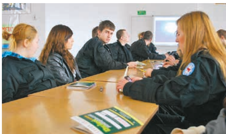
Klasa o profilu policyjnym (2010-2013) podczas zajęć

Rada powiatu podczas gruniowej sesji podjęła uchwałę w sprawie wystąpienia do Ministra Obrony Narodowej z wnioskiem