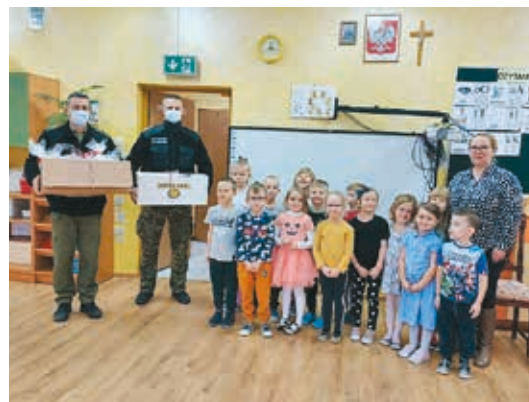
Przedszkole nr 1

Bez chwili zastanowienia hajnowskie przedszkola przystąpiły do Ogólnopolskiej akcji społecznościowej „Murem za Polskim Mundurem”. Do akcji włączyły się dzieci z rodzicami oraz wszyscy pracownicy placówek pragnąc wyrazić swoją wdzięczność za trud i poświęcenie dla naszej Ojczyzny.