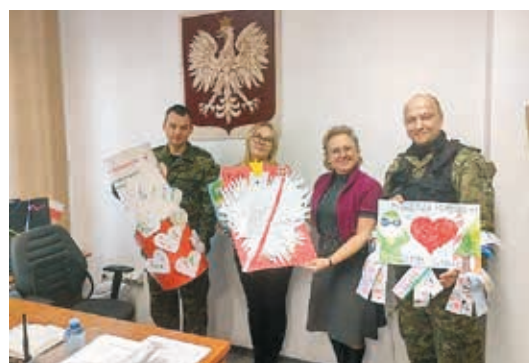
Przedszkole nr 3