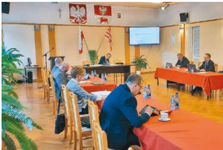
Sesja budżetowa Rady Powiatu w Bielsku Podlaskim odbyła się w trybie zdalnym

30 grudnia ub. roku rada powiatu uchwaliła budżet na 2022 rok. Podczas sesji obecni byli wszyscy radni w liczbie 17. Podjęli oni uchwałę budżetową jednogłośnie,