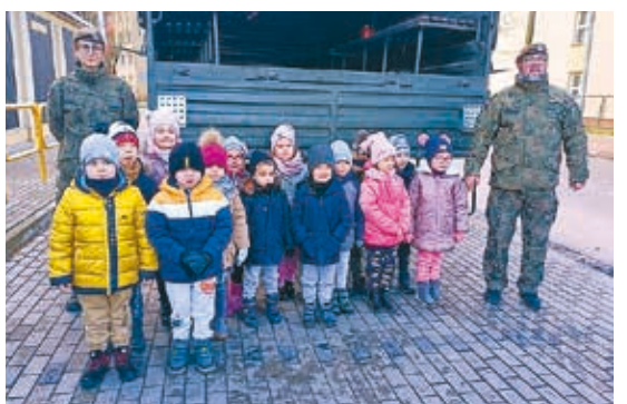
Przedszkole nr 5