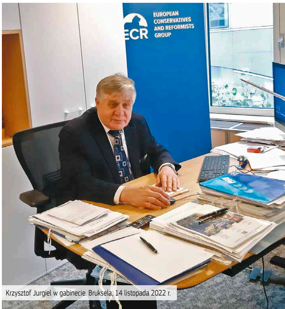
Krzysztof Jurgiel w gabinecie. Bruksela, 14 listopada 2022 r.

Koszty całego pobytu, w tym transport, zostały pokryte z funduszy unijnych.