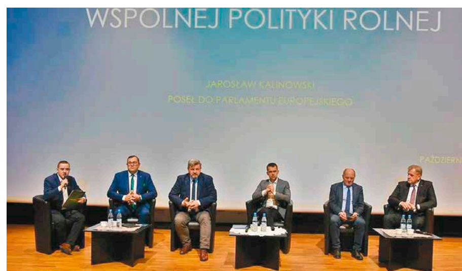
Debata PSL „Przyszłość podlaskiego rolnictwa”. 25 listopada 2022 r., Bielsk Podlaski.

25 listopada 2022 r. w Bielskim Domu Kultury odbyła się debata dotycząca rozwoju rolnictwa, w tym głównie podlaskiego. Inicjatorem i organizatorem konferencji był poseł Stefan Krajewski, członek sejmowej komisji rolnictwa i rozwoju wsi.