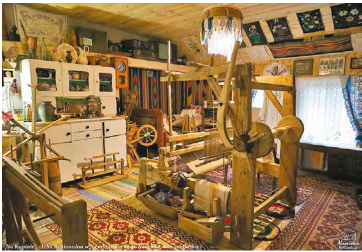
„Na Kupinie” – Izba Regionalna w Siemianówce (gm. Narewka, woj. podlaskie)

Autor tekstu i zdjęć: Mariola German-Pietruczuk