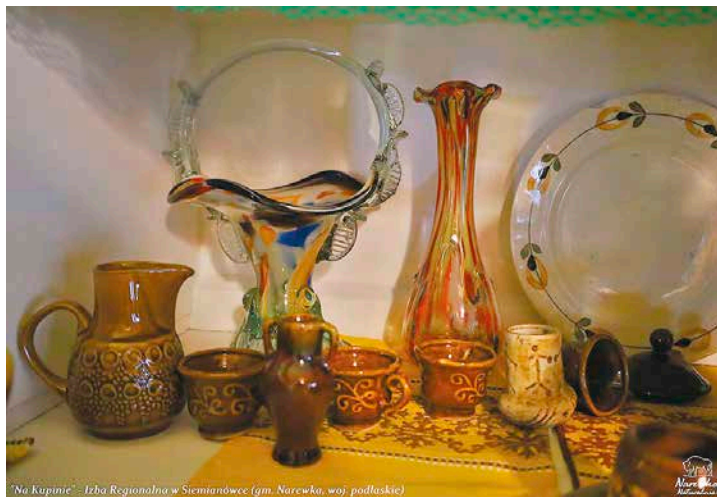
„Na Kupinie” – Izba Regionalna w Siemianówce (gm. Narewka, woj. podlaskie)

I tak oto w przytoczonej izbie, która od niedawna ma już