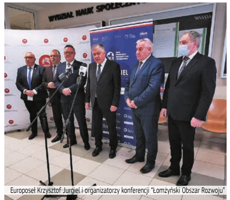
Europoseł Krzysztof Jurgiel i organizatorzy konferencji „Łomżyński Obszar Rozwoju”

O Wspólnej Polityce Rolnej i Krajowym Planie Strategicznym mówił poseł Kazimierz Gwiazdowski: – Ważne jest, aby w ramach zreformowanej WPR wsparcie bezpośrednie trafiło do realnie prowadzących działalność rolniczą.