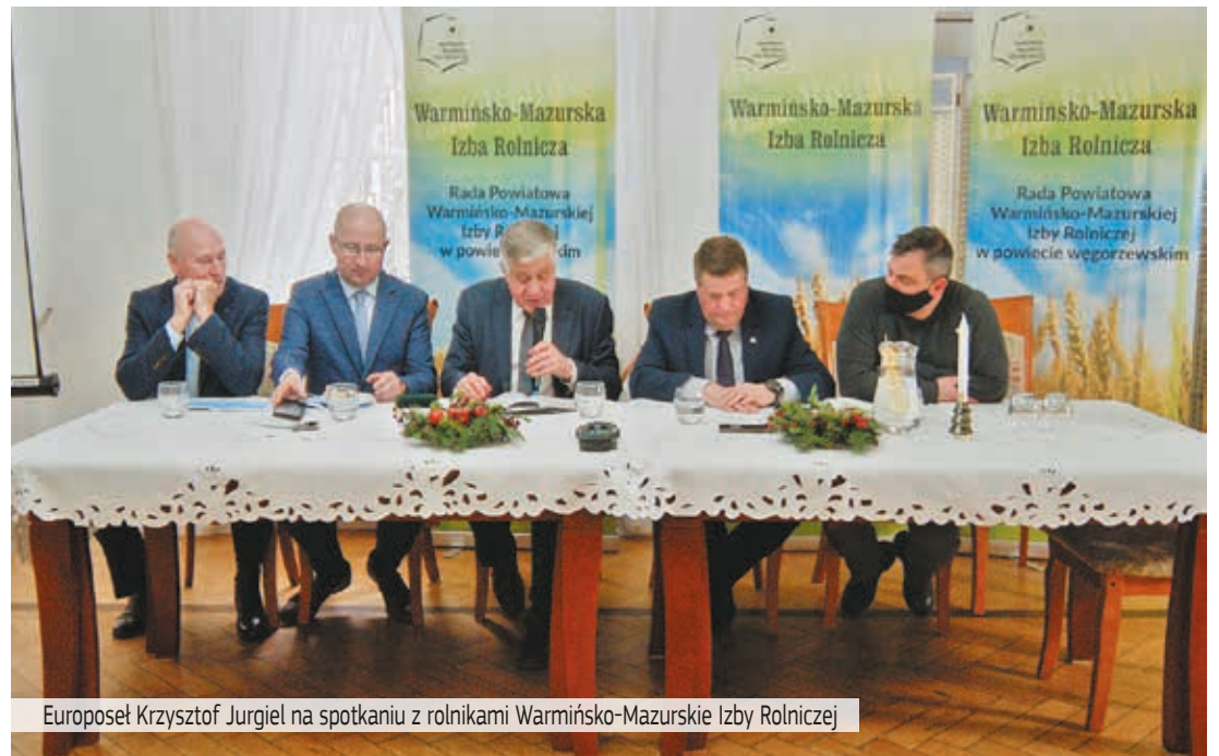
Europoseł Krzysztof Jurgiel na spotkaniu z rolnikami Warmińsko-Mazurskiej Izby Rolniczej