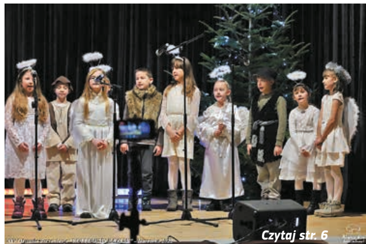
Czytaj str. 6