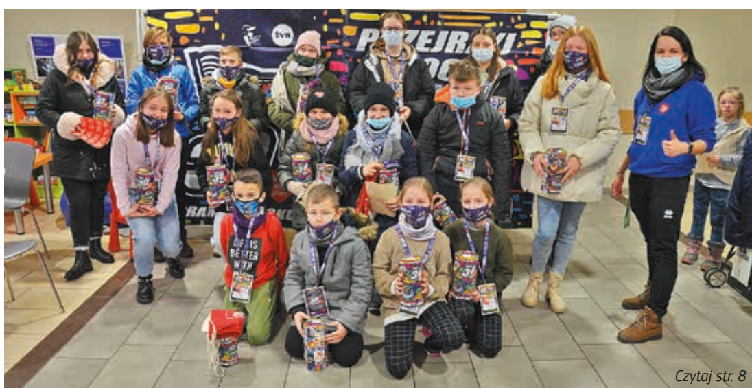
Czytaj str. 8