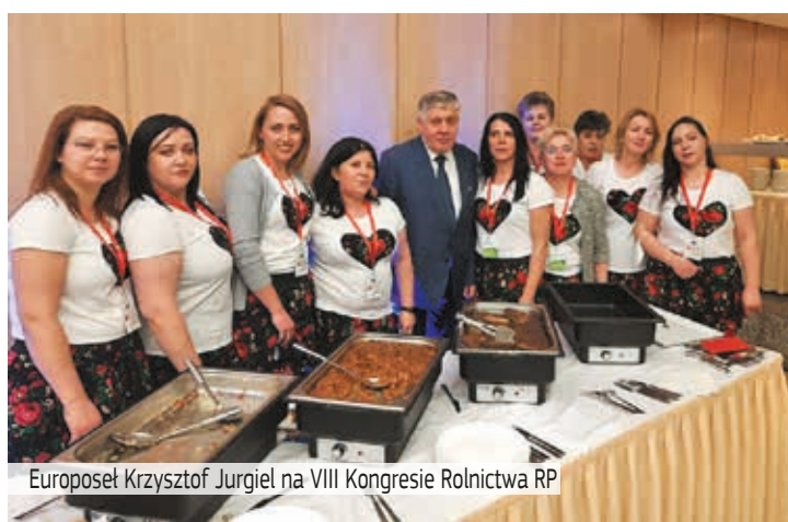
Europoseł Krzysztof Jurgiel na VIII Kongresie Rolnictwa RP

Polityka rozwoju UE i rządu polskiego szansą dla naszego rolnictwa – tak można określić sedno wystąpienia posła Krzysztofa Jurgieła. Odnosząc się do dokumentów programowych UE, europoseł podkreślił, jakie konsekwencje dla rolnictwa wyplývają ze Strategii Europejskiego Zielonego Ładu, którego nadrzędnym celem jest osiągnięcie neutralności klimatycznej, realizacji wizji Europy bez CO2 do 2050 r. Przewiduje się nowe przepisy dotyczące gospodarki o obiegu zamkniętym, renowacji budynków, różnorodności biologicznej, zrównoważonego transportu.