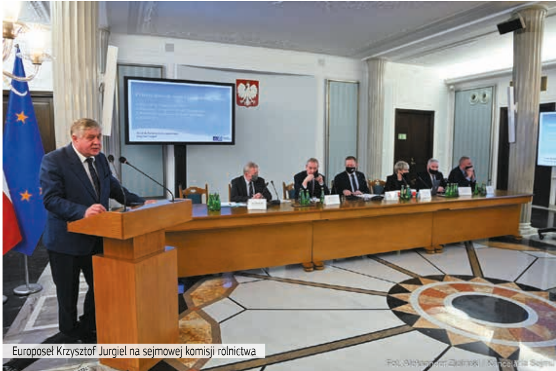
Europoseł Krzysztof Jurgiel na sejmowej komisji rolnictwa

„Liczne ostatnio protesty rolnicze, które się w Polsce odbywają, też są dla Brukseli ważnym sygnałem, że proponowane strategię budzą społeczny sprzeciw i niezadowolenie” - Krzysztof Jurgiel