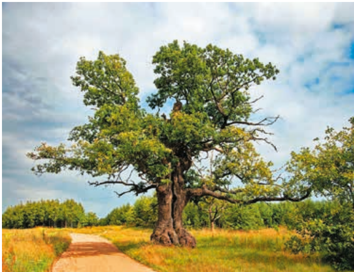
Ten dąb rośnie koło wsi Przybudki w gminie Narew (powiat hajnowski).