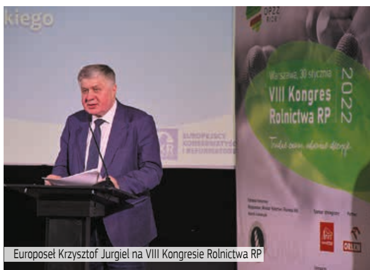
Europoseł Krzysztof Jurgiel na VIII Kongresie Rolnictwa RP

„Szanse rozwojowe dla naszego rolnictwa i wsi polskiej stwarzają środki finansowe pochodzące z wieloletnich budżetów unijnych, Polityki Spójności, Wspólnej Polityki Rolnej (WPR), programu „Jednolity rynek, innowacje i technologie cyfrowe” oraz Plan Odbudowy dla Europy” – podkreślił i przypomniał Krzysztof Jurgiel.