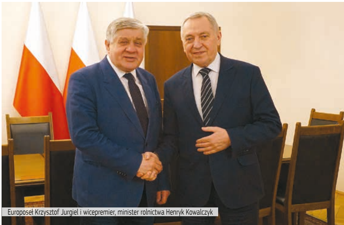
Europoseł Krzysztof Jurgiel i wicepremier, minister rolnictwa Henryk Kowalczyk