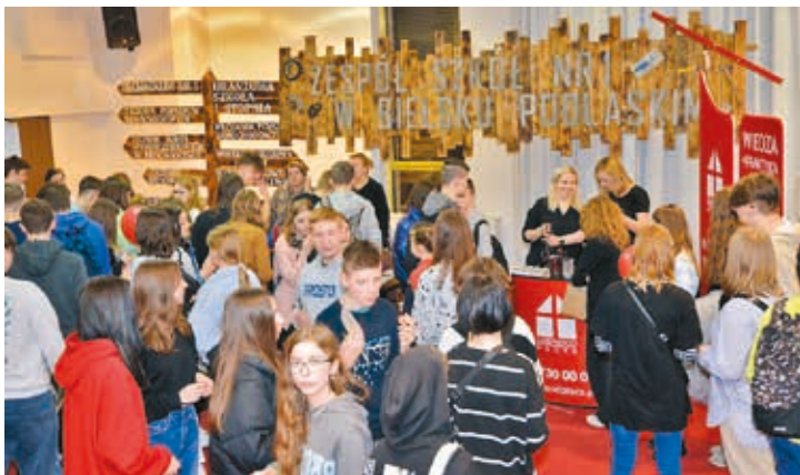
Stoiska wystawowe szkół prowadzonych przez Powiat Bielski cieszyły się wielkim zainteresowaniem zwiedzających

Starosta podziękował również szkołom, które wystawiły swoje stoiska promocyjne, podkreślając jednocześnie, iż szkoły z subregionu bielskiego wzmacniają jego potencjał poprzez odpowiednie wykształcenie młodzieży i jej późniejsze zatrudnianie się w tym regionie.