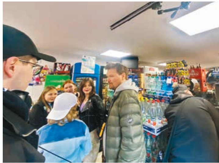
Pierwsza scena miała miejsce w sklepie u pani Eli

W Michałowie rozpoczęły się, 29 kwietnia, zdjęcia do nowej polskiej komedii „Ślicznotka”, której akcja rozgrywa się na Podlasiu. Ma to być film o akceptacji, marzeniach, przyjaźni i miłości, a miasteczko zagra niedużą, ale nowoczesną miejscowość na wschodzie Polski.