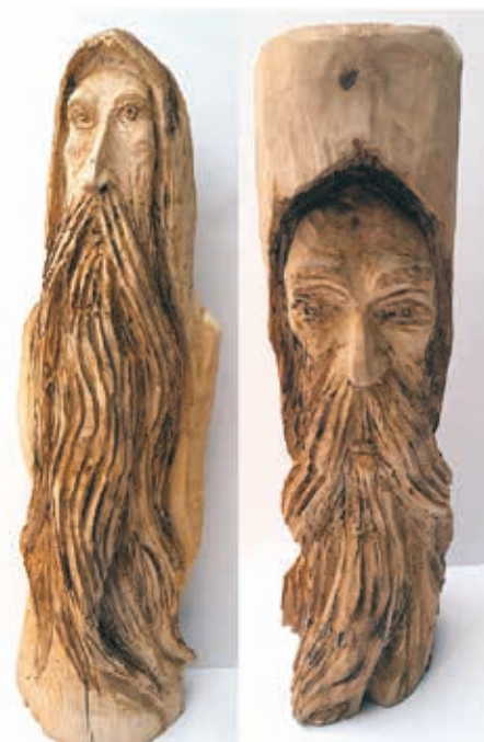
I Nagroda (rzeźba) Marek Sapiotko, Duch Puszczy I i II, rzeźba w drewnie