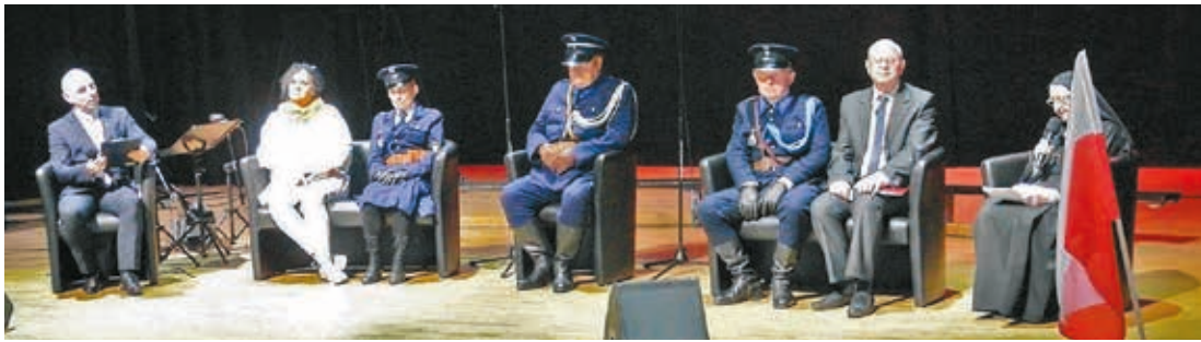
Projekcję filmu „Przywrócić pamięć” poprzedziły prelekcje historyczne