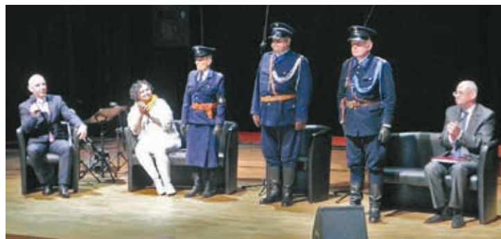
Prezentacja mundurów policyjnych Grupy Rekonstrukcji Historycznej „Policja Państwowa ‘39’ z Białegostoku