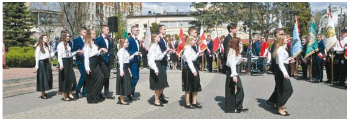
Poloneza zatańczyli uczniowie I Liceum Ogólnokształcącego im. Tadeusza Kościuszki w Bielsku Podlaskim