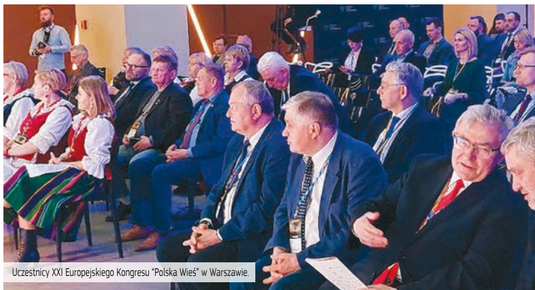
Uczestnicy XXI Europejskiego Kongresu "Polska Wieś" w Warszawie.

W Polsce obszary leśne stanowią jedną trzecią kraju, pod tym względem znajdujemy się w czołówce państw europejskich. Co zatem oznacza realizacja unijnej strategii? W myśl polityki UE, podkreślanej przez Fransa Timmermansa, będziemy musieli wyłączyć z gospodarki leśnej ponad 3 mln ha. Projekt objęcia aż 10 % obszaru UE „ochroną ścisłą”