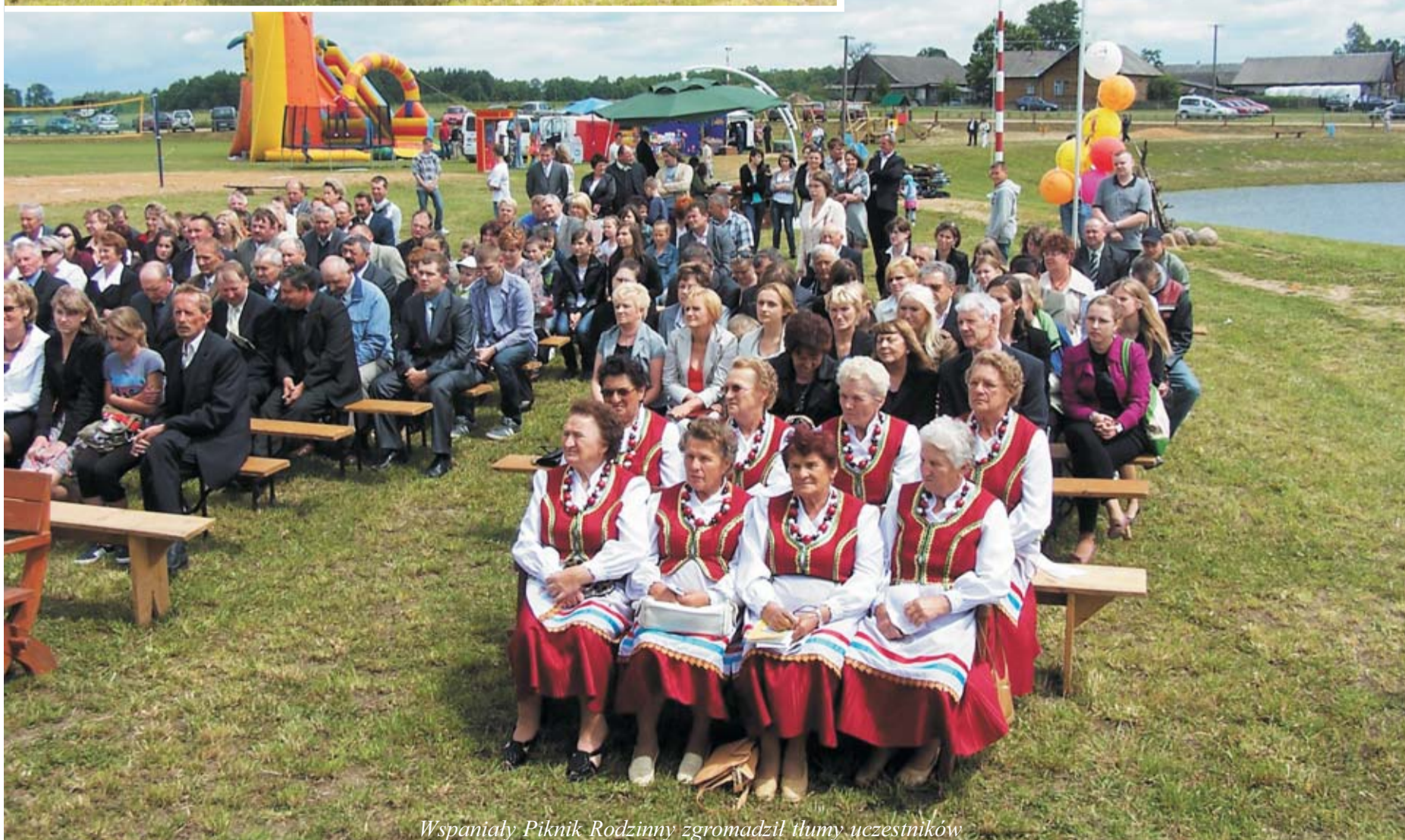
Wspaniały Piknik Rodzinny zgromadził tłumy uczestników