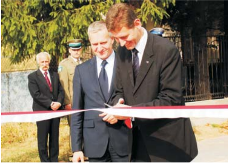
Przecięcia wstęgi dokumuje Maciej Żywno, wojewoda podlaski.