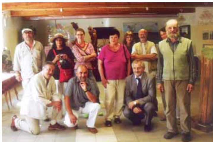
Spotkanie plenerowe 2011

Drewnianych domów w Lewkowie Nowym już się nie buduje