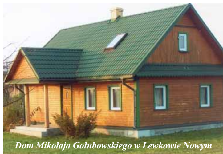
Dom Mikołaja Gołubowskiego w Lewkowo Nowym