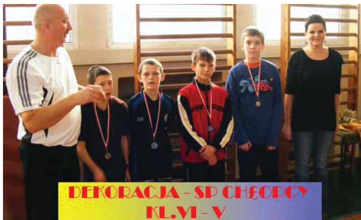
DEKORACJA - SP CHŁOPCY KL.VI - V