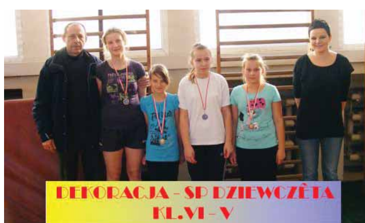
DEKORACJA - SP DZIEWCZĘTA KL.VI - V