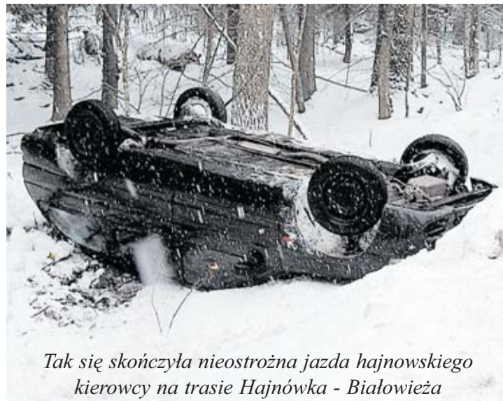
Tak się skończyła nieostrożna jazda hajnowskiego kierowcy na trasie Hajnówka - Białowieża

Oczekujemy Państwa zgłoszeń w postaci szczegółowego CV na adres: pawel.sikorski@ipf-internet.com lub na nr fax 61 843 01 13 dopisując w temacie maila „rzeźnik rekrutacja”